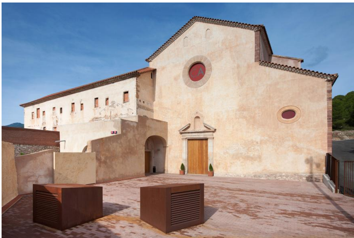
Façana principal del Convent de les Arts

Ajuntament d'Alcover Plaça Nova, 1 43460 Alcover (Alt Camp) CATALUNYA (Espanya)