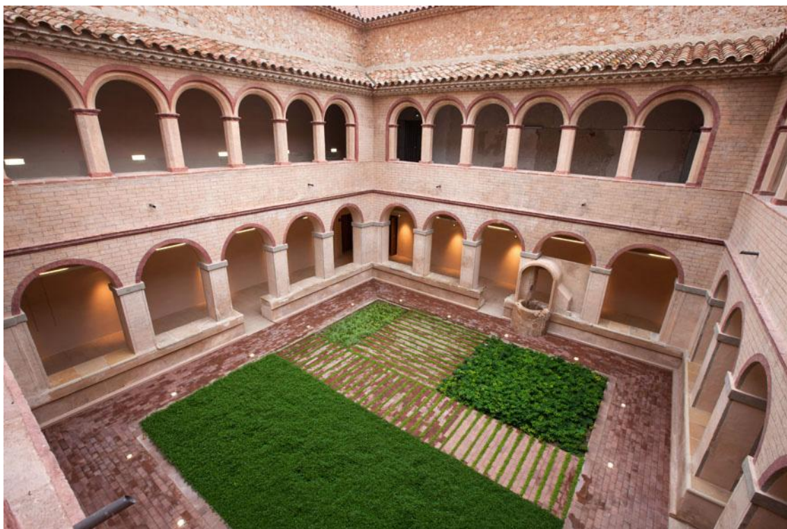
El claustre intern del Convent de les Arts